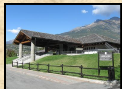
Edificio polifunzionale Grand Place